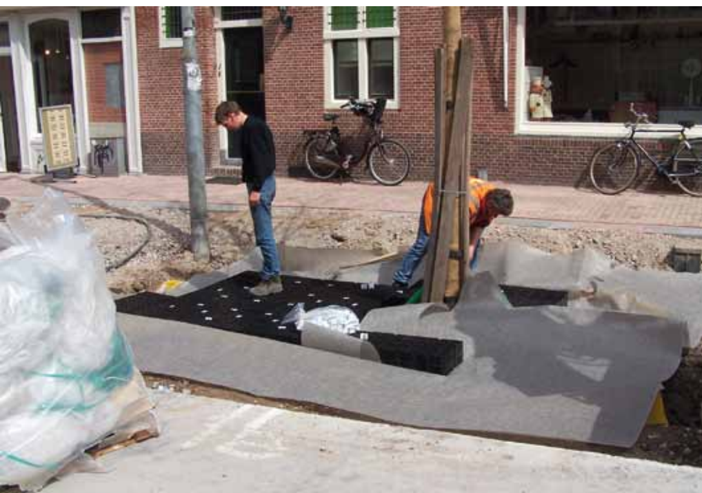
Combinatie granulaat en tweede maaiveld.