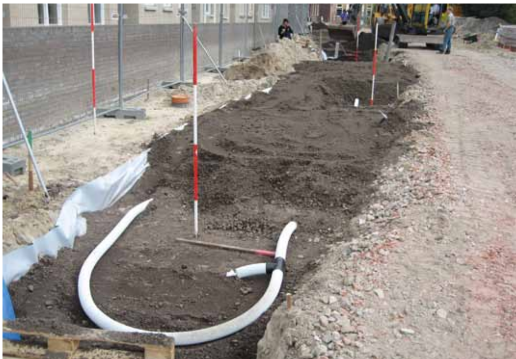
Boomstraat met granulaat in een wortelstraat.

Bij veel groeiplaatsen is de grond dikwijls te nat doordat de grondwaterspiegel in Nederland vaak