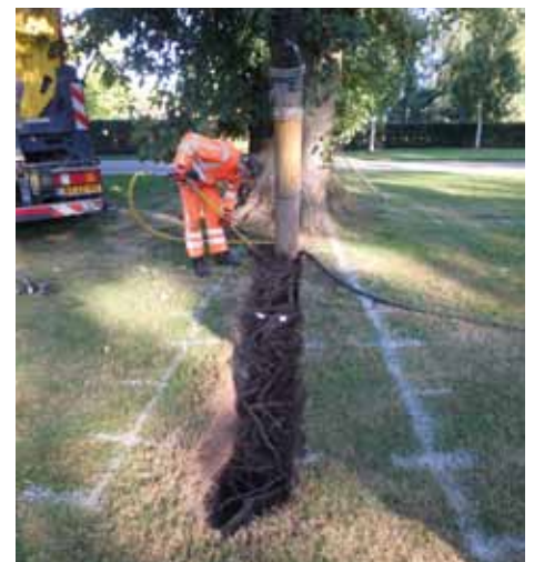
Het maken van de validatiesleuven tijdens de grondradarproef in Utrecht.