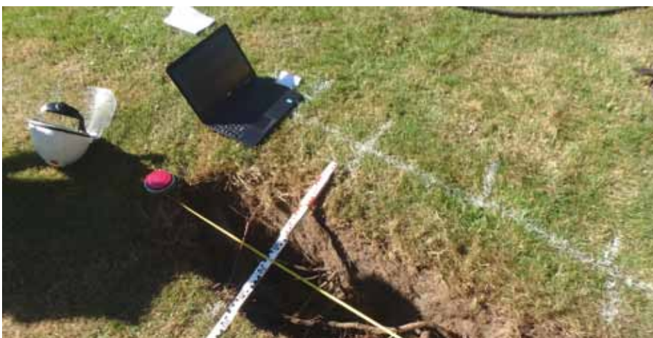
Locatie en worteldimensies werden nauwkeurig vastgelegd tijdens de grondradarproef in Utrecht.