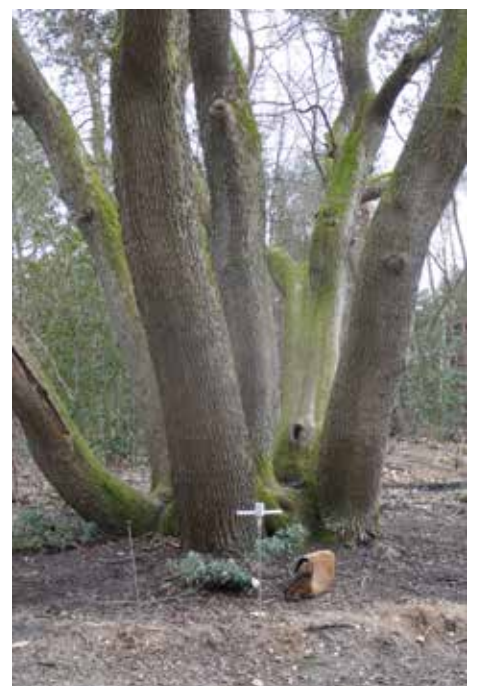
Eikenopstand gemeente Horst aan de Maas