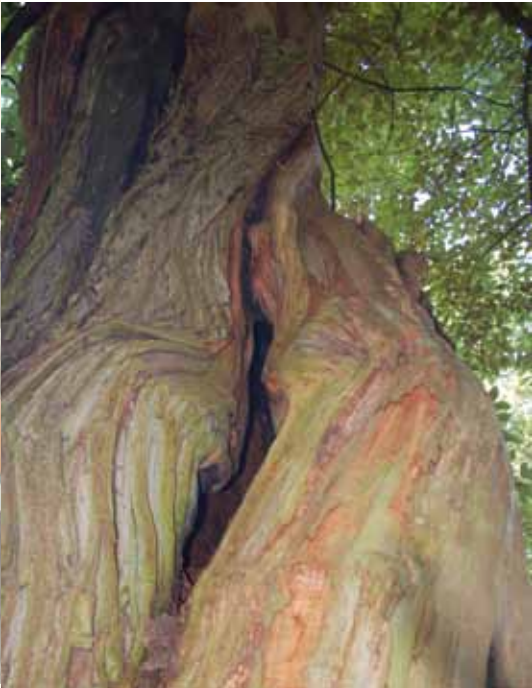
'De gedraaide bast vind ik prachtig', aldus Spijker.