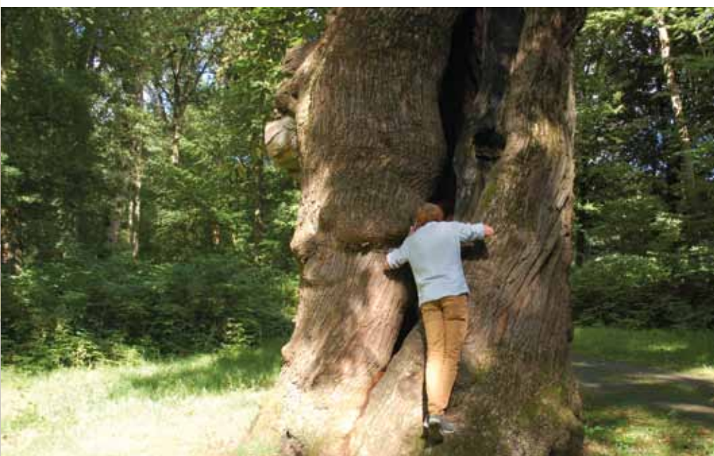
De tamme kastanjes zijn in goede conditie ondanks alle holtes en spleten.