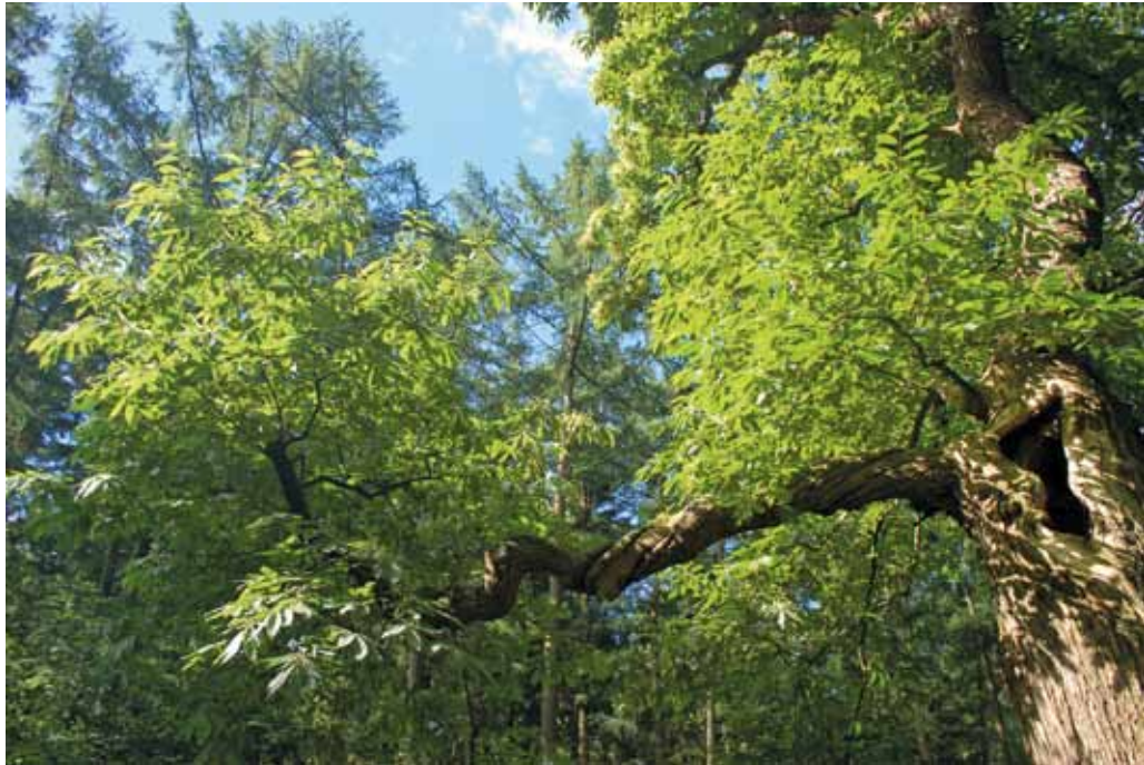
De gesteltakken van deze joekels zijn al bomen op zich.

De drie tamme kastanjes kunnen volgens Spijker nog honderden jaren mee. 'Het is eigenlijk een mooi systeem dat een boom als hij ouder wordt, aangetast wordt en hol. Daardoor blijft hij langer staan en breekt er hooguit hier en daar een tak uit. Als de boom massief zou blijven en zou doorgroeien, zou hij eerder in zijn geheel omvallen. Het is wel belangrijk dat de drie tamme kastanjes worden begeleid in hun aftakelingsfase. Ik zou aanraden om de groeiplaatsen af te zetten, zodat ze niet meer betreden kunnen worden, en de