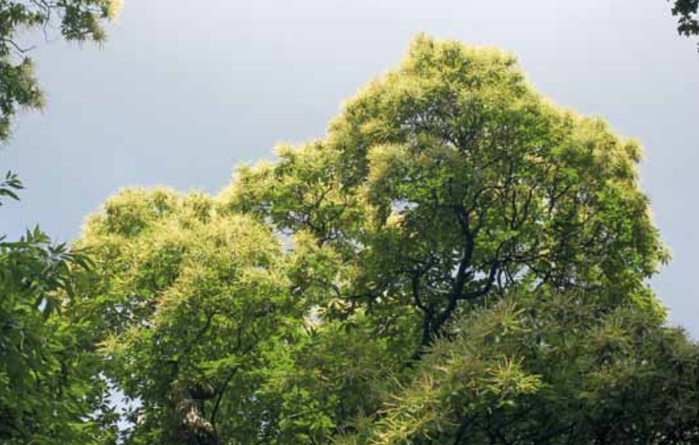
Witte bloemetjes stralen in de zon.

de Romeinen verwilderde de boomsoort en bleef hij aangeplant worden.'