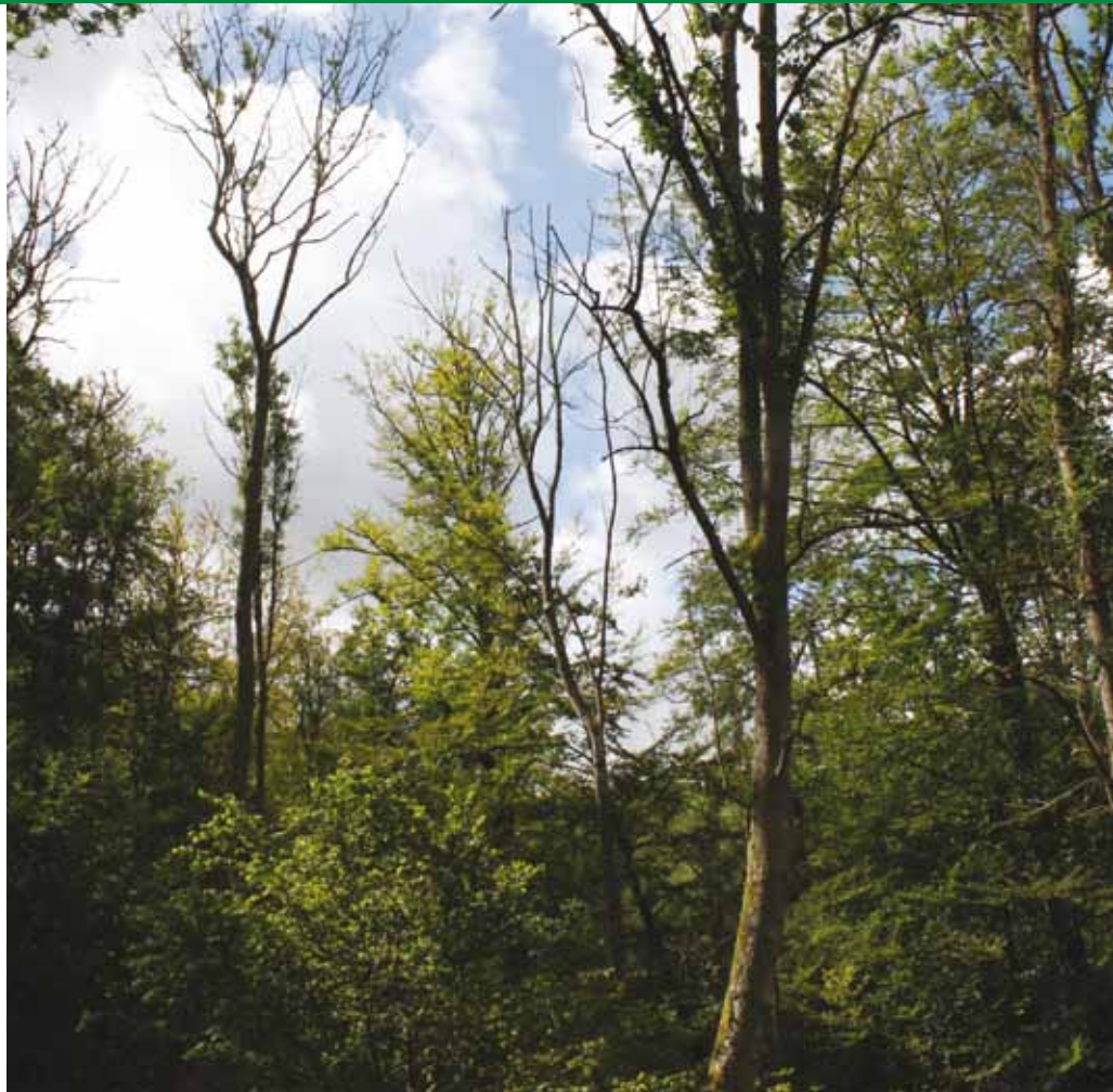
Dode en zwaar beschadigde bomen in het Grib Skov Bos, Noord Zeeland, Denemarken.

In Duitsland zijn we momenteel wel bezig met praktijkonderzoeken naar vatbaarheid voor essensterfte in droge en natte bodems.