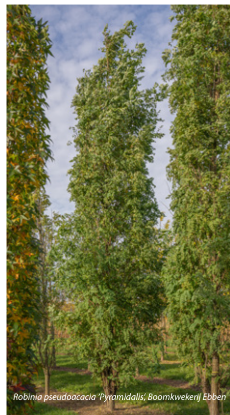
Robinia pseudoacacia 'Pyramidalis' , Boomkwekerij Ebben

Robinia x slavinii 'Hillieri' is een kruising van