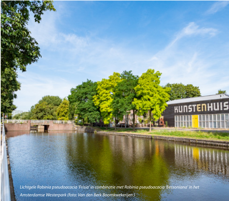
Lichtgele Robinia pseudoacacia 'Frisia' in combinatie met Robinia pseudoacacia 'Bessoniana' in het Amsterdamse Westerpark