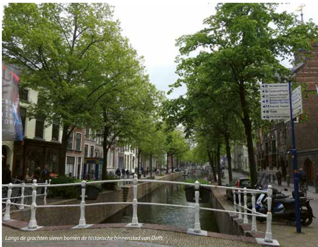
Langs de grachten sieren bomen de historische binnenstad van Delft.