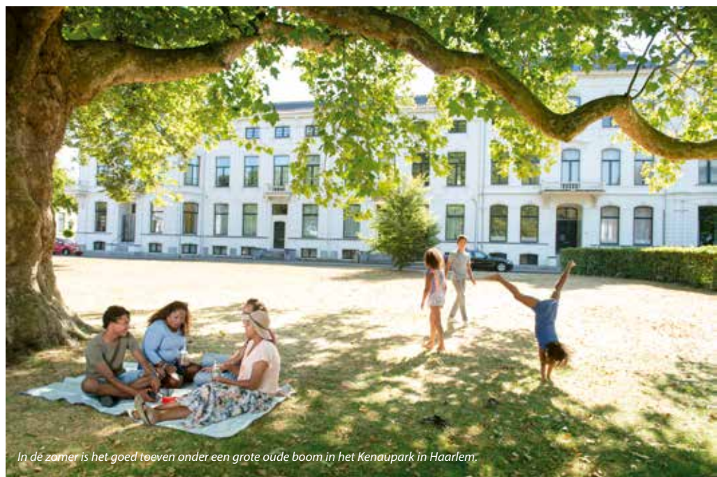
In de zomer is het goed toeven onder een grote oude boom in het Kenaupark in Haarlem.

Wat de drie gemeentes delen, is het belang om van vergroening een gemeenschappelijke opgave te maken. Het mes snijdt hierbij aan