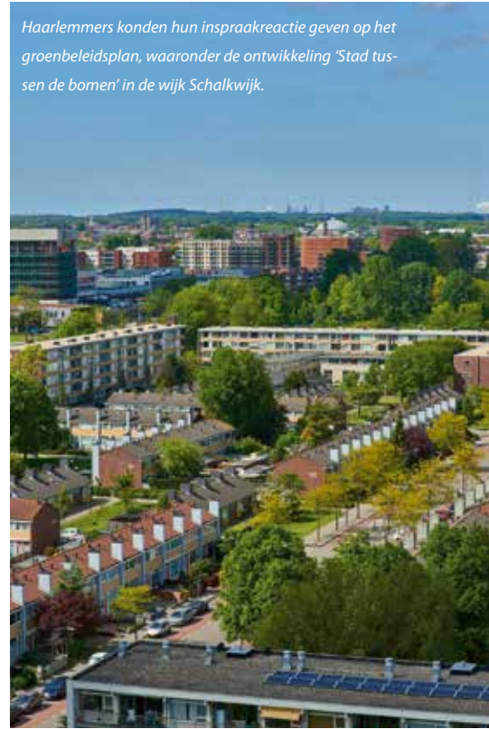
Haarlemmers konden hun inspraakreactie geven op het groenbeleidsplan, waaronder de ontwikkeling 'Stad tussen de bomen' in de wijk Schalkwijk.