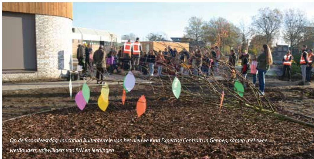
Op de Boomfeestdag: inrichting buitenterrein van het nieuwe Kind Expertise Centrum in Gennep, samen met twee wethouders, vrijwilligers van IVN en leerlingen