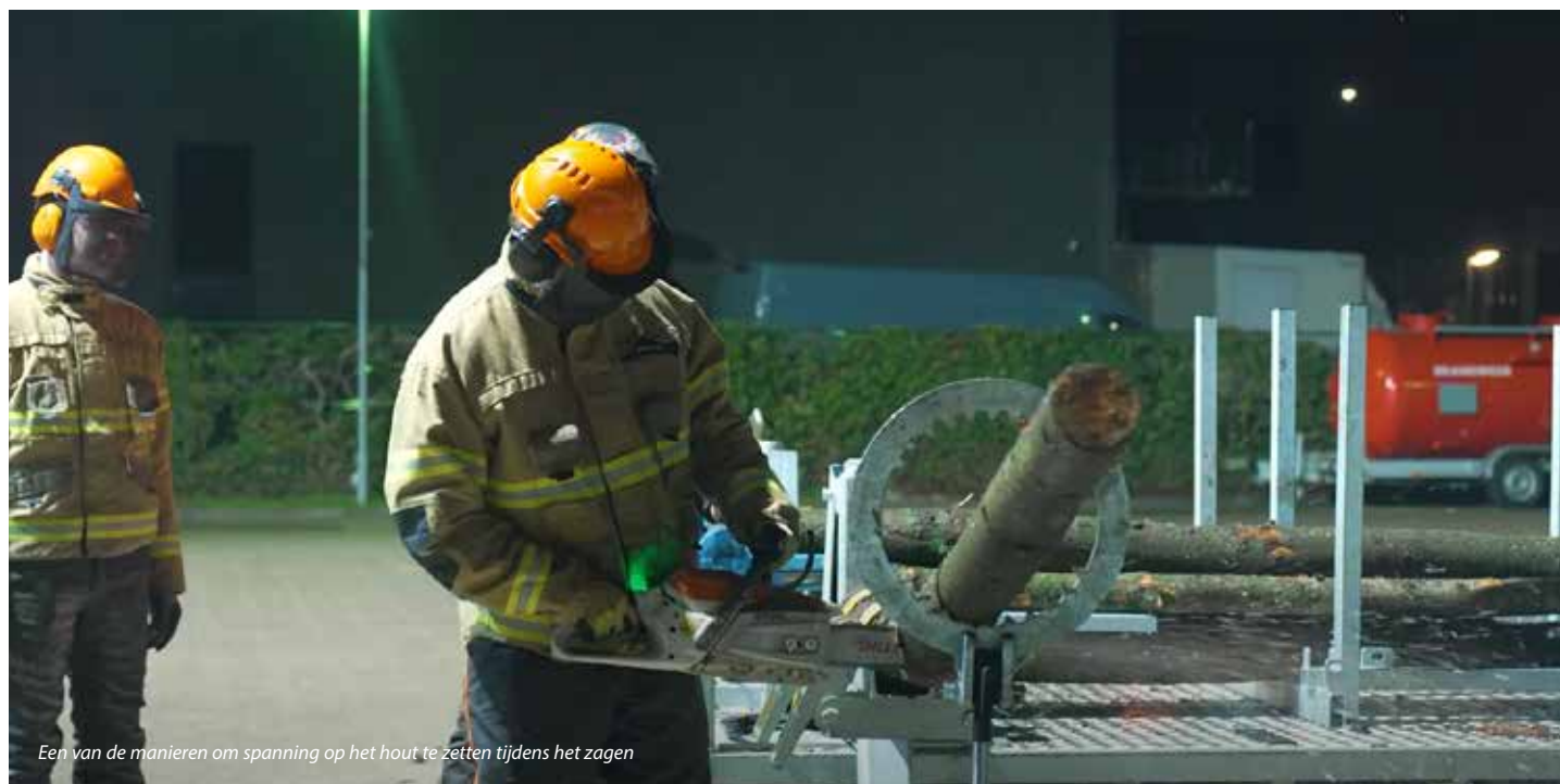
Een van de manieren om spanning op het hout te zetten tijdens het zagen