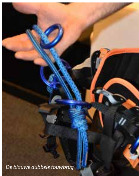
De blauwe dubbele touwbrug

presentatie doorspekte met veel humor. 'Vallen is voor een klimmer niet erg, maar neerkomen doet écht pijn. In dit verband is de dubbele touwbrug aan de klimgordel waaraan je de klimlijn of de werkpositioneringslijn bevestigt, van essentieel belang. Zo werkt Husqvarna met verschillende kleuren; de blauwe kleur van de Husqvarnagordel duidt erop dat je er veilig aan kunt gaan hangen.'