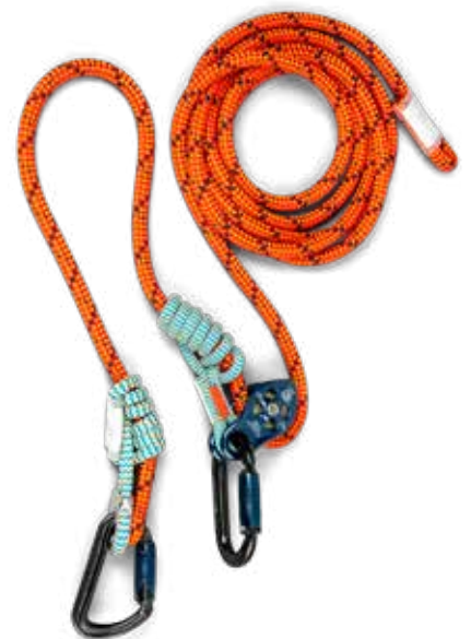
Het werkpositioneringskoord met prusikknoopen

een lijn zodanig aan een andere lijn te bevestigen dat deze eenvoudig kan worden afgesteld. Voor de volledigheid liet De Groot ook een aantal mechanische klim- en neerlaatinrichtingen zien, zoals de mechanische prusik. Deze zorgen ervoor dat de lijn er doorloopt als de gebruiker langs de boom omhoog klimt. Zo'n systeem heeft een zelfvergrendeling die in werking treedt zodra er sprake is van een neerwaartse kracht. Daardoor kan de klimmer gecontroleerd afdalen. Verder zorgt zo'n mechanische prusik ervoor – net als de conventionele prusik – dat de gebruiker zich efficiënt in en rond de kruin van de boom kan bewegen.