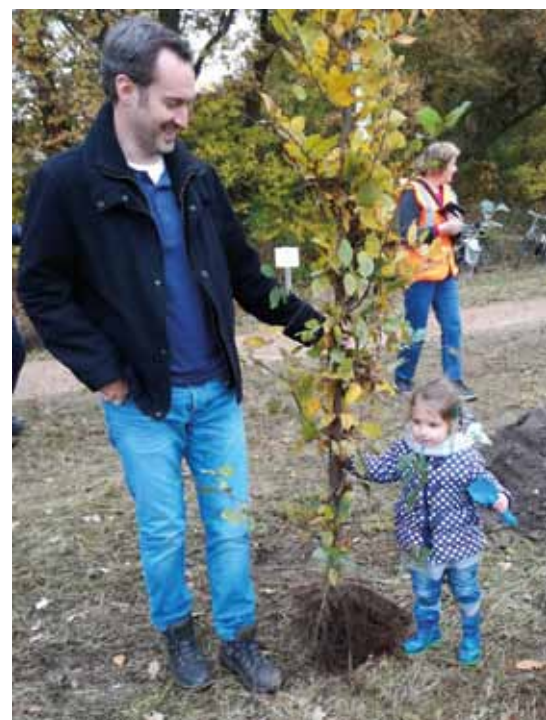
De plantdagen trokken deelnemers van alle leeftijden.