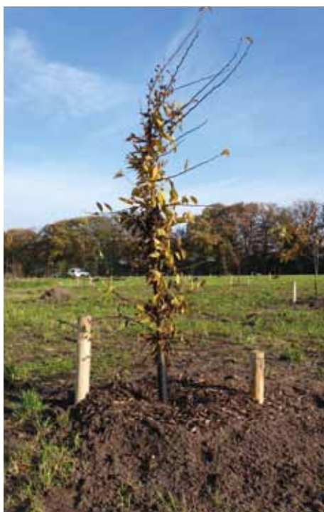
De bomen worden geplant een tijdelijke en blijvende paal, een stambeschermer en voorzien van compost een laag mulch.

In de overeenkomst wordt opgenomen dat de stichting voor een periode van vijf jaar verantwoordelijk is voor de grond en de bomen. Daarna wordt het bos overgedragen aan de gemeente.