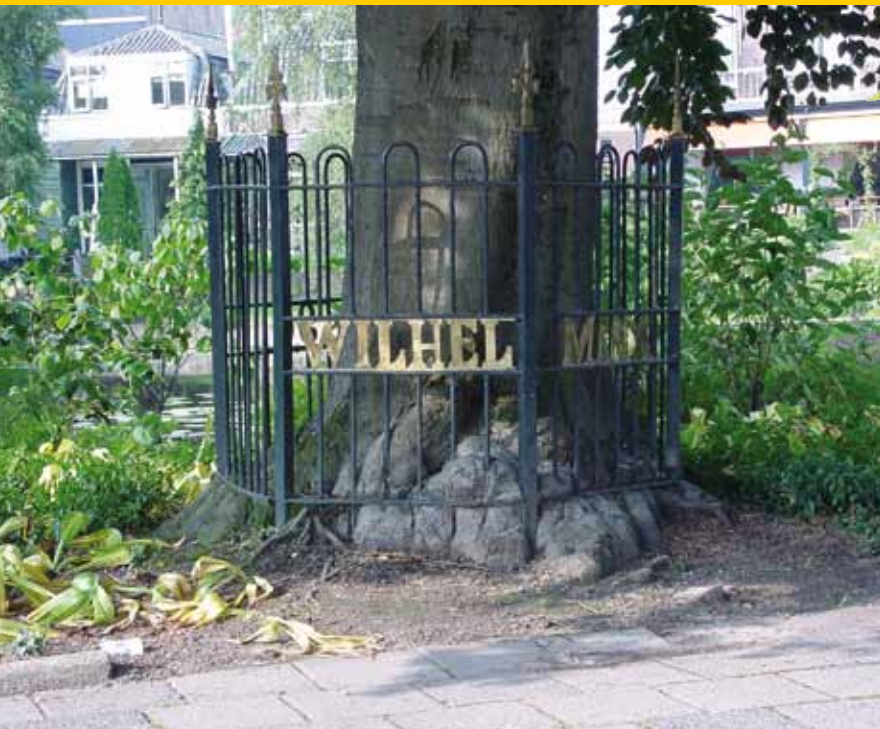
Henry Kuppen: Dit betreft een roodharige Wilhelminabeuk uit 1898 in Haastrecht met een te klein geworden hek er omheen!