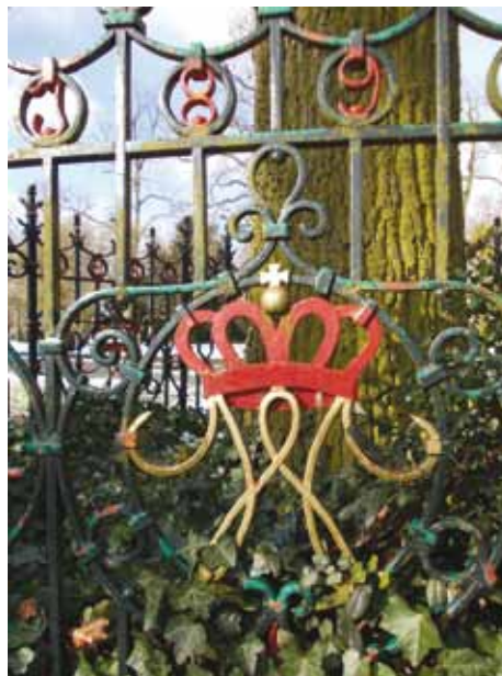
Herdenkingsboom Tilia x Europaea 'Koningslinde', in het Wilhelminapark te Venlo geplant ter gelegenheid van de kroning van Hare Majesteit de Koningin Wilhelmina op 6 september 1898. Voor de inhuldiging van koning Willem-Alexander heeft boomkwekerij J.H. Faassen-Hekkens eveneens Tilia x europaea 'Koningslinde' op de kwekerij staan.