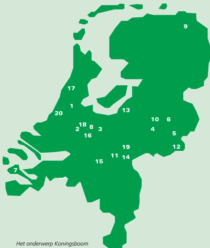
Het onderwerp Koningsboom leeft. Op dit kaartje het resultaat van een uurtje 'Koningsboom googelen'.

100 jaar uit te kunnen groeien. Zowel onder- als bovengronds. Een beetje in de diepte, een beetje in de breedte, maar vooral in de hoogte. De boom haalt namelijk makkelijk een lengte 20 meter.